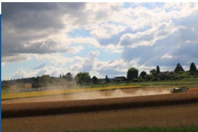
1 ère place : Mme Félix Raymonde