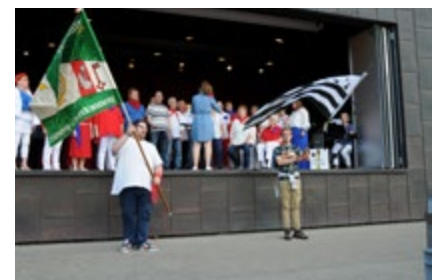
Le chœur mixte de Bussy-Chardonney qui chantait le lien fort entre son village et celui de Teillay

Selon le calendrier, en 2029, pour les 30 ans du jumelage, ce sont les Suisses qui feront le déplacement en Bretagne. D'ici là, une question reste ouverte aux autorités. Comment s'appellent les habitants de Hautemorges ? Et ne dites pas qu'ils ne s'appellent pas parce qu'ils viennent tout seuls.