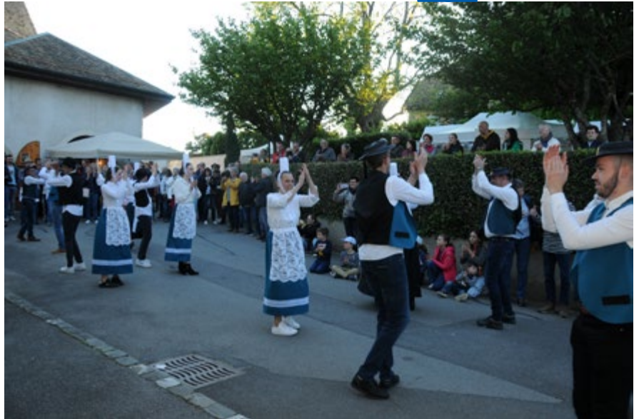
La prestation du jeudi soir des Bretons qui avaient réalisé leurs costumes